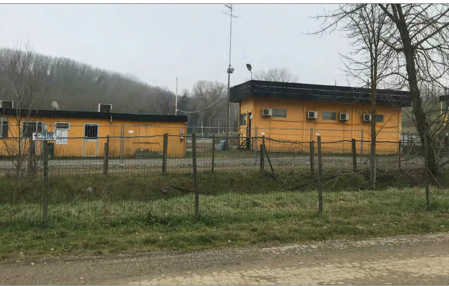
Fabbricati esistenti prospicienti la partenza