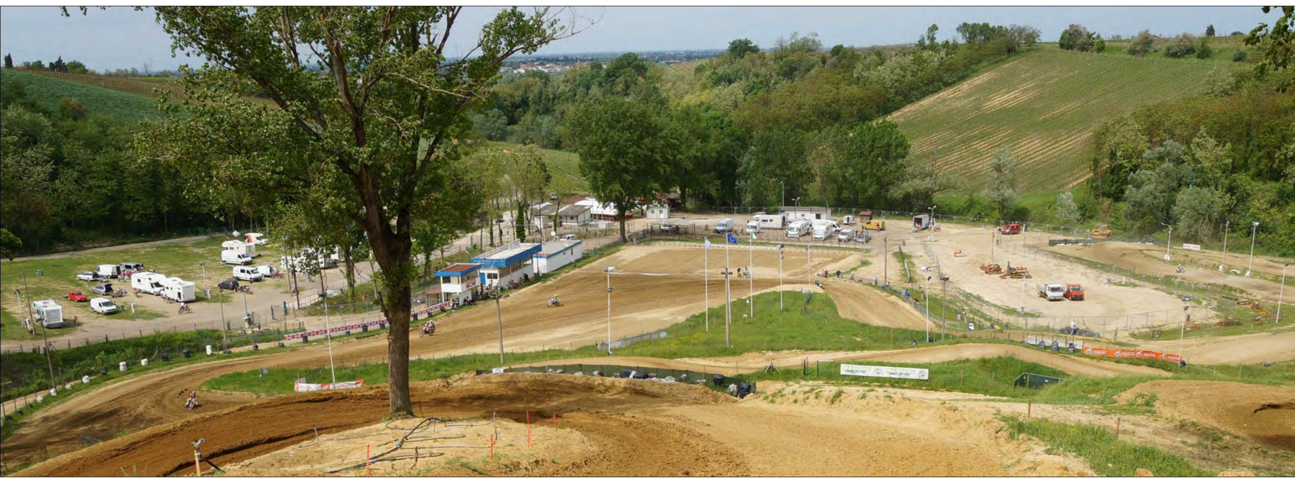
Foto partenza pista e area paddock