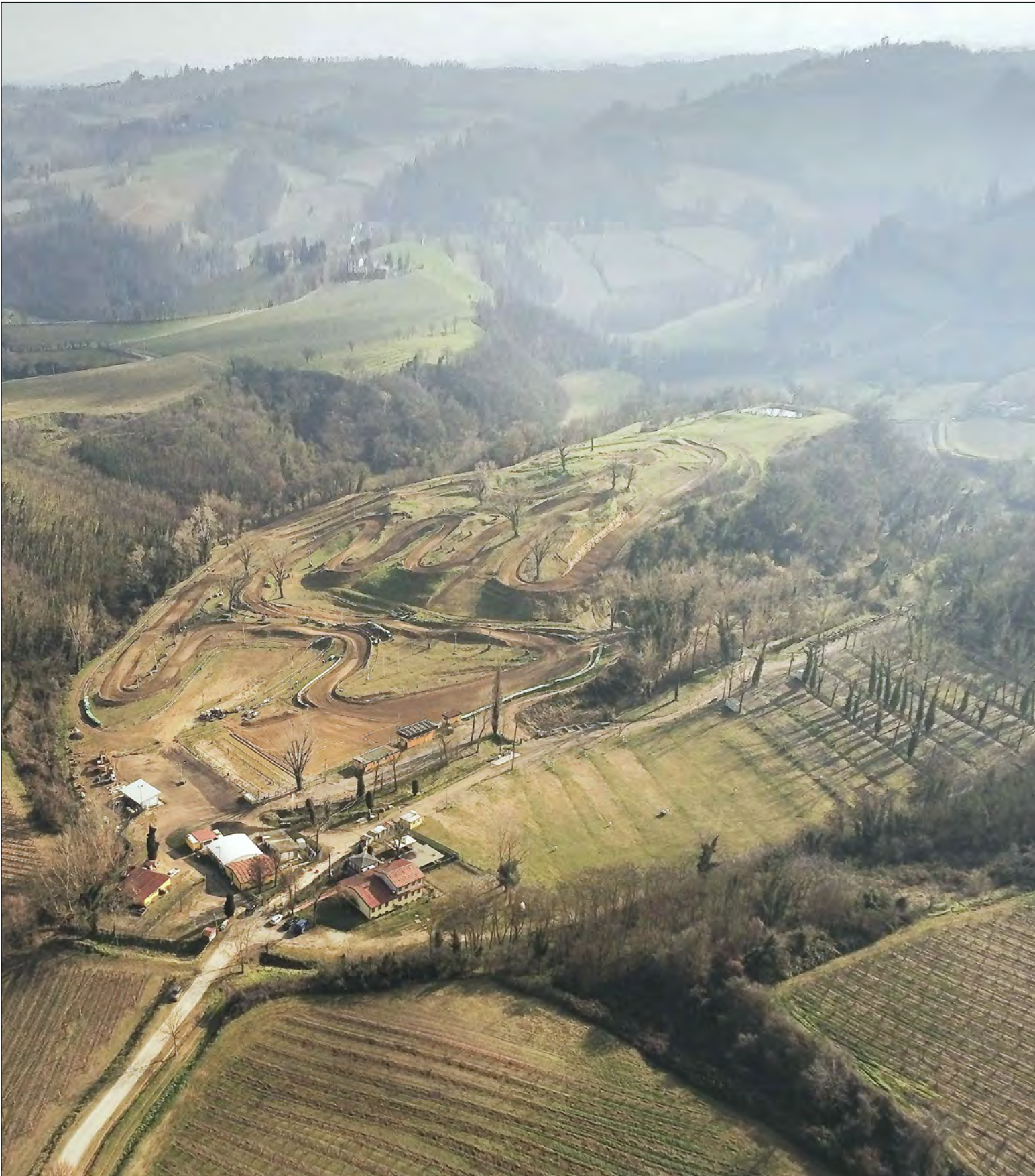
Foto aerea Crossodromo Monte Coralli