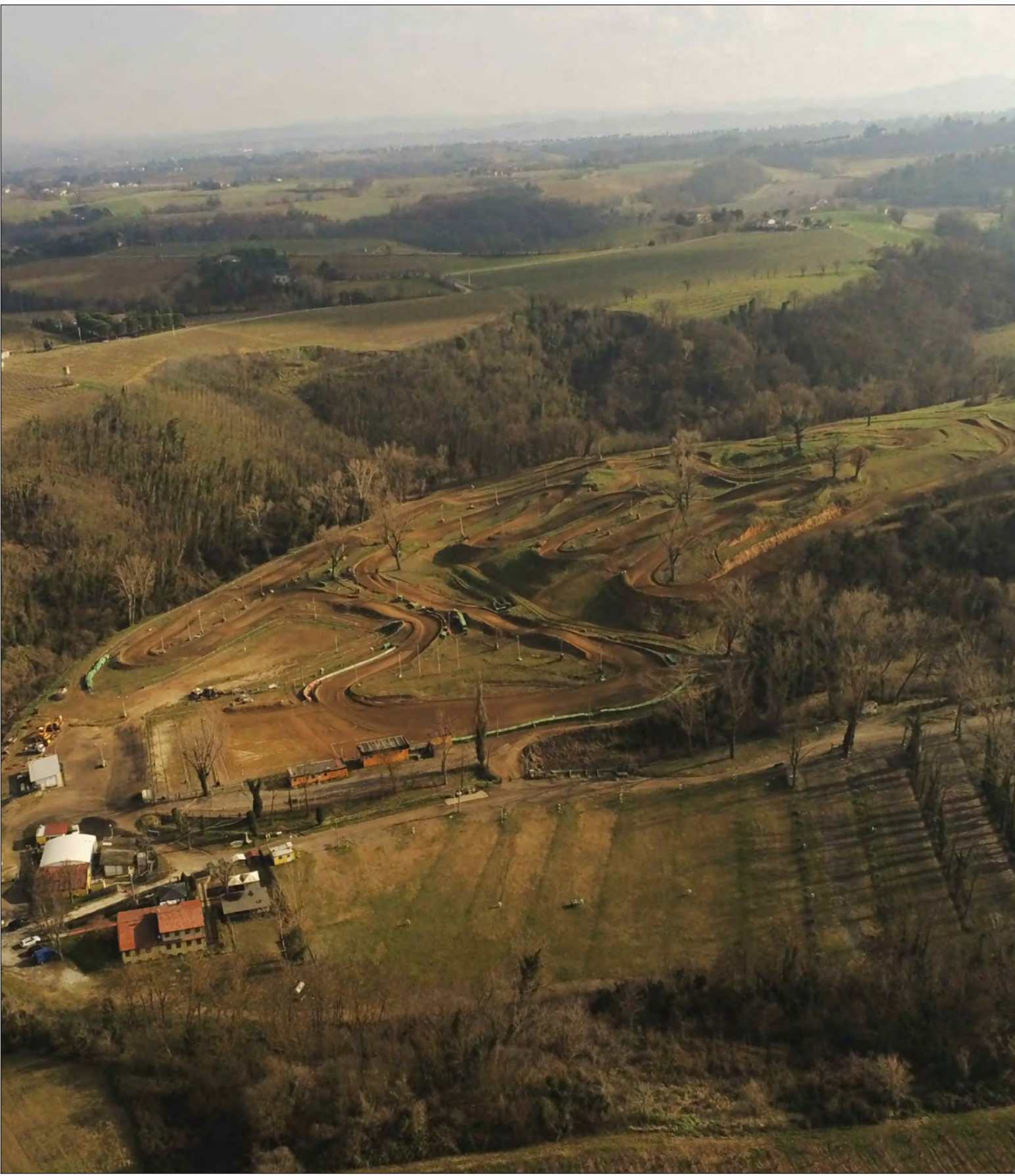
Foto aerea pista Monte Coralli