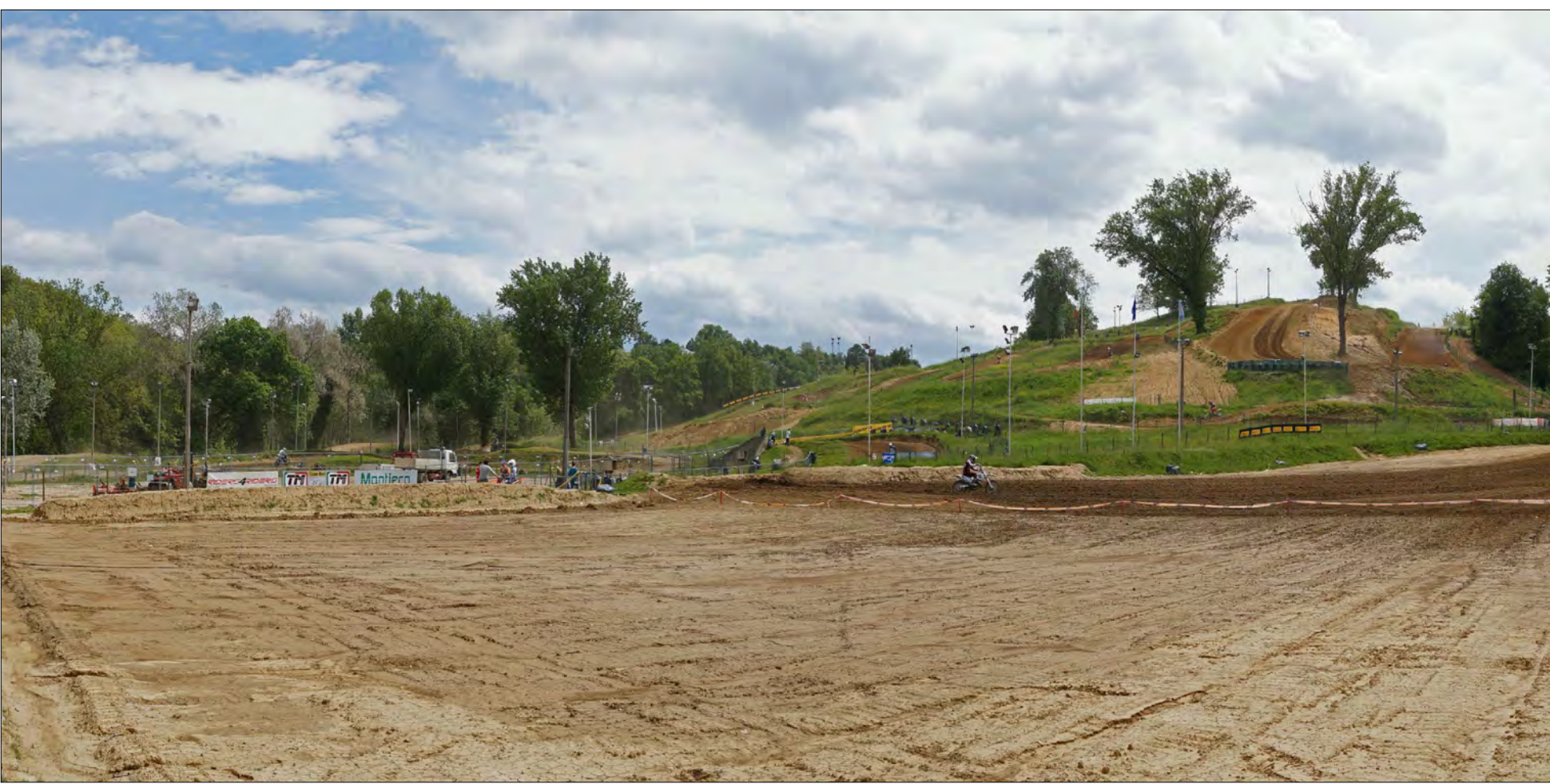
Foto pista motocross dalla partenza